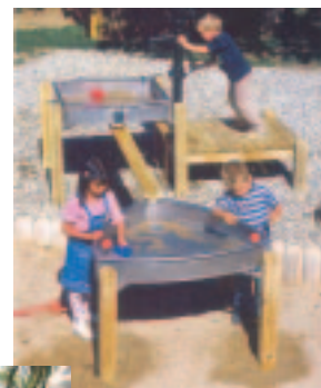
Die Wasserspielanlage für die Kinderheimat (oben)