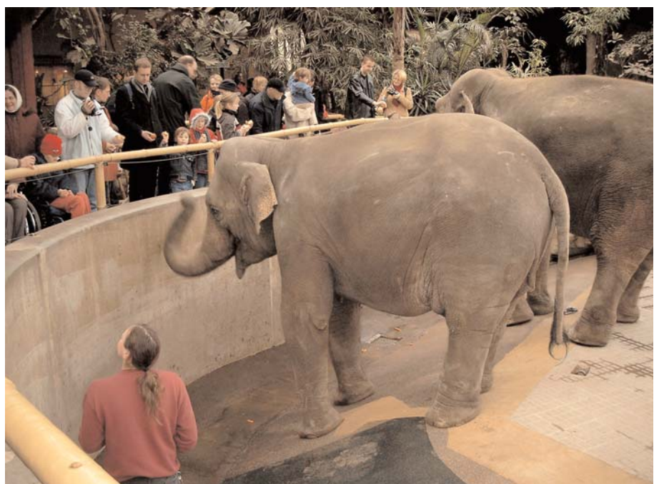
Zoobesuchen mit Bewohnern

Wir fördern die Pflege von Pflanzen zur Gestaltung und Bereicherung des Wohnungslebens, der Wohnumgebung und zur Schaffung eines angenehmen Raumklimas. Die Bewohner werden ermuntert, die Pflanzen mit Hilfestellung regelmäßig zu gießen und zu pflegen.