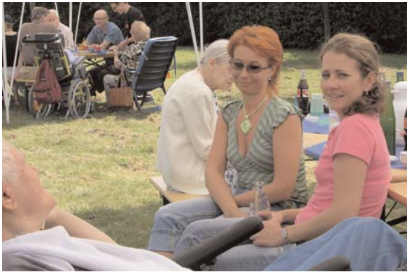
Ein schöner Garten zur Erholung und zum Feiern