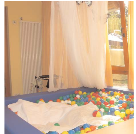
Ein Bällchenbad dient der Entspannung

In den zentral gelegenen und ästhetisch ausgestatteten Wohnzimmern schaffen wir eine Atmosphäre der