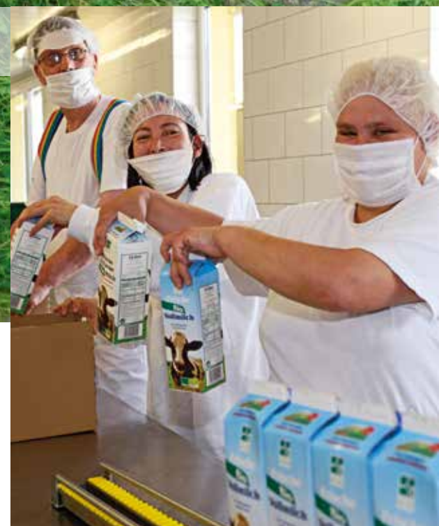
In bester Lippequalität: täglich frische Biomilch.