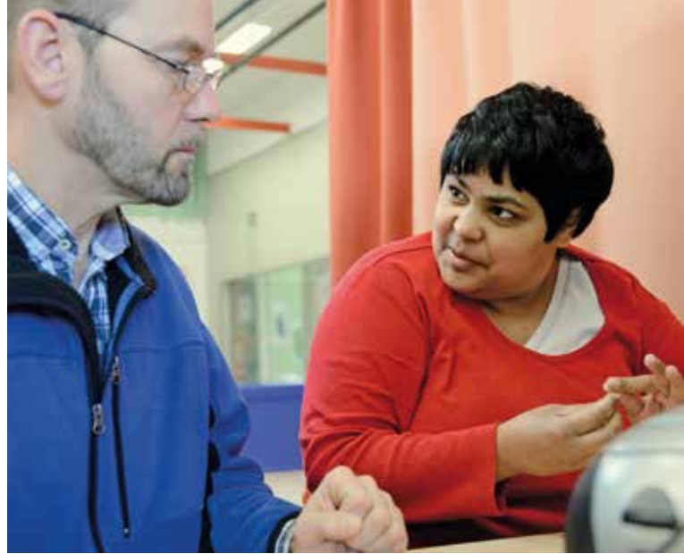
Gemeinsam zum Ergebnis

Ob einfache Verpackungsaufträge oder komplexe Fertigungen mit hohen Stückzahlen – unser Team umfasst mehr als 400 Mitarbeitende mit und ohne Einschränkungen und ist quantitativ und qualitativ für Problemlösungen aller Art aufgestellt. Qualifizierte Fachkräfte begleiten jeden Auftrag individuell. Gemeinsame Entwicklungsprojekte mit namhaften Unternehmen bezeugen die Lösungskompetenzen von eeWerk.